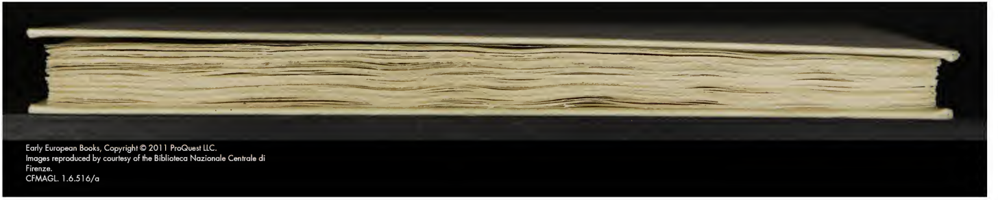
Early European Books, Copyright © 2011 ProQuest LLC. Images reproduced by courtesy of the Biblioteca Nazionale Centrale di Firenze. CFMAGL 1.6.516/a